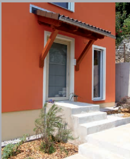
Minergie-Haus TI-060-P in Orselina mit Wohnung im Erd- und Dachgeschoss sowie Akupunkturpraxis im Untergeschoss. Durch die grosse Photovoltaikanlage auf dem Dach produziert dieses Haus über das Jahr gesehen mehr Energie, als es verbraucht.