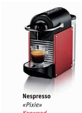
Nespresso «Pixie» Kenwood Wert CHF 179.–