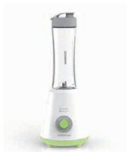
Zwei Smoothie Maker «SMP060WG» Kenwood Wert CHF 69.–