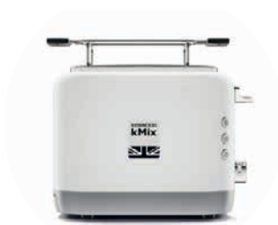
Toaster «kMix TCX751WH» Kenwood Wert CHF 119.–