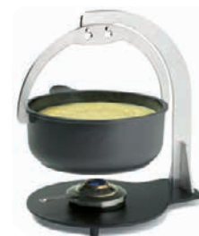
Fondueset «Sepp» Stadler Form Wert CHF 229.–