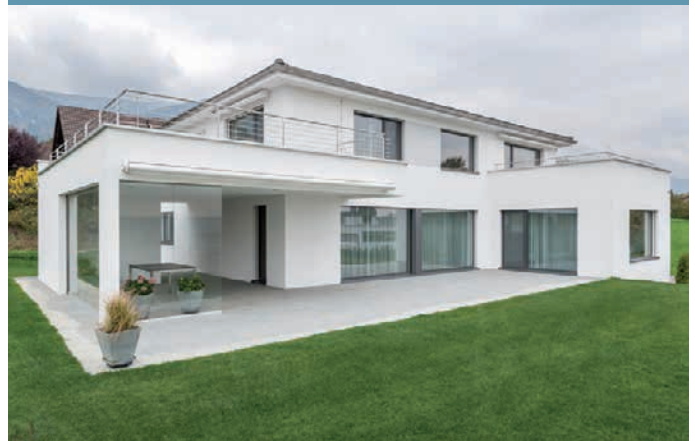
Kategorie Massivbau Marty Designhaus AG