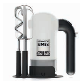
Handmixer «kMix HMX750WH» Kenwood Wert CHF 129.–