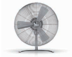
Ventilator «Charly Floor» Stadler Form Wert CHF 179.–