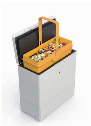
1. Preis Kompostkühler «Freezyboy» Avantyard Wert CHF 800.–