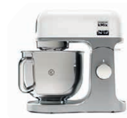
Küchenmaschine «kMix KMX750WH» Kenwood Wert CHF 599.–