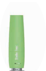
Bedufter «Lea» Stadler Form Wert je CHF 89.–