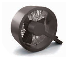
Ventilator «Q» Stadler Form Wert CHF 195.–