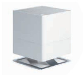
Luftbefeuchter «Oskar» Stadler Form Wert CHF 179.–

Wählen Sie das «Haus des Jahres 2017» und sichern Sie sich die Chance auf einen der hier abgebildeten Preise. Die Preise werden unabhängig von der Abstimmung unter allen vollständig und leserlich ausgefüllten Stimmzetteln verlost (eine Einsendung pro Teilnehmer). Zur Abstimmung geht es online unter www.das-einfamilienhaus.ch/wettbewerb oder via Teilnahmecoupon auf Seite 140.